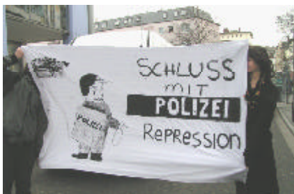
Demo am 15.3. in Gießen (s. Seite 3)